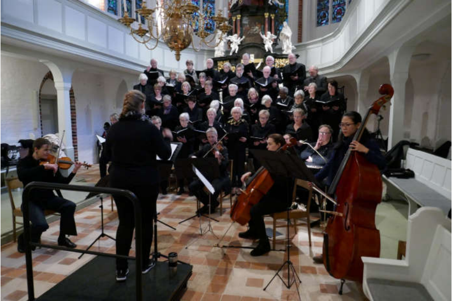
Konzert des Singkreises am 4. November