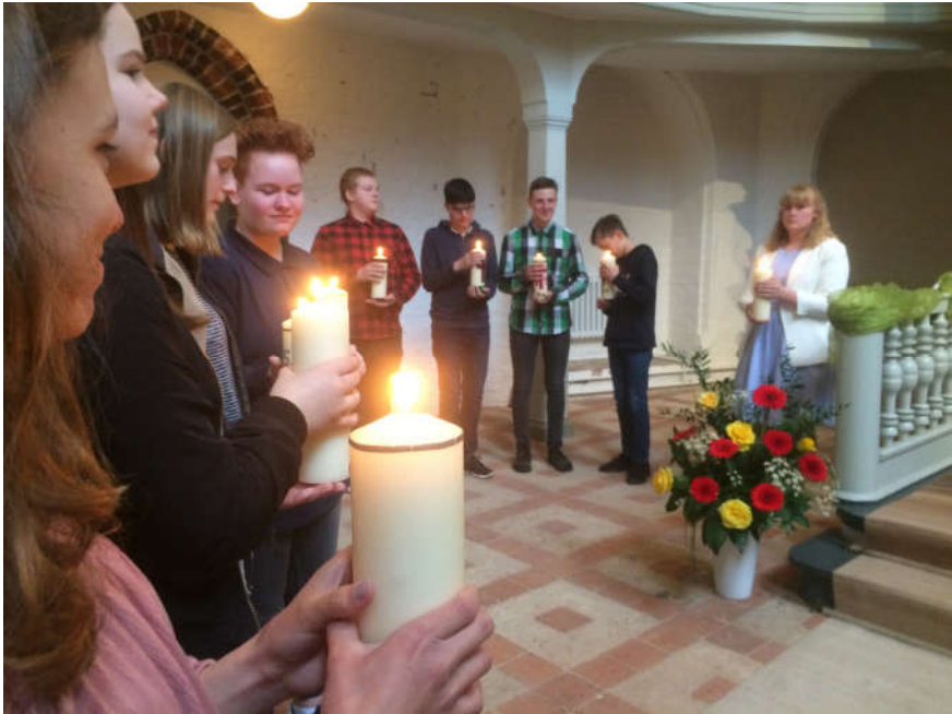
Abendmahlsgottesdienst zur Konfirmation 2019 in Ebstorf Regionalgottesdienst am Himmelfahrtstag 2019 im Arboretum Melzingen