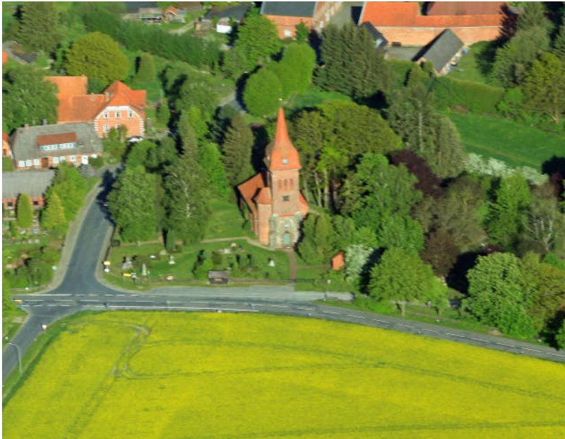
„Perspektivwechsel“ - Seiten 20-21