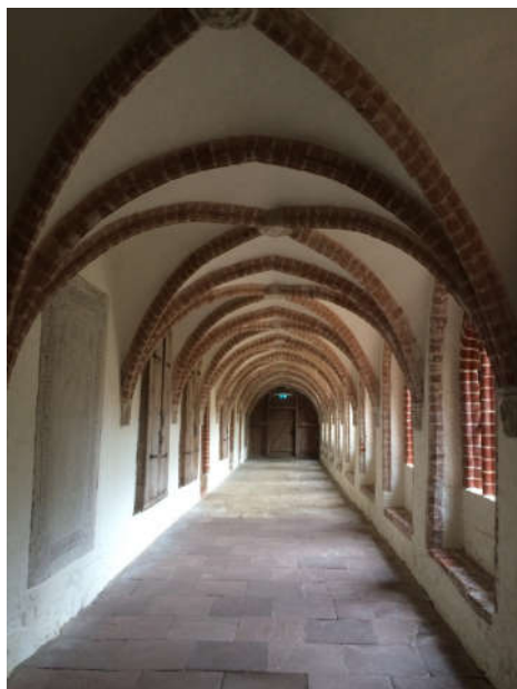
Kreuzgang im Kloster Isenhagen Taufe in der Klosterkirche Isenhagen