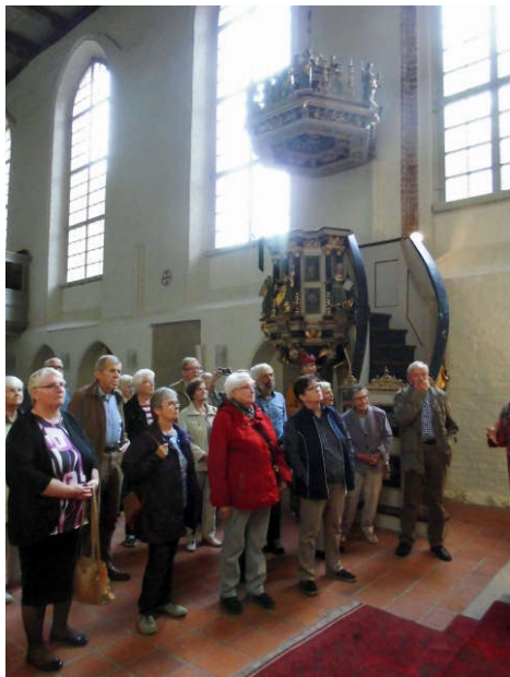
In der Klosterkirche Isenhagen Lesung im Partnerschafts-Gottesdienst