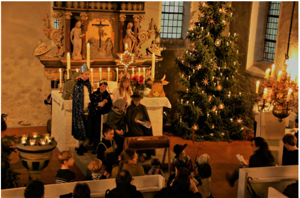
Krippenspiel am Heiligabend in Barum