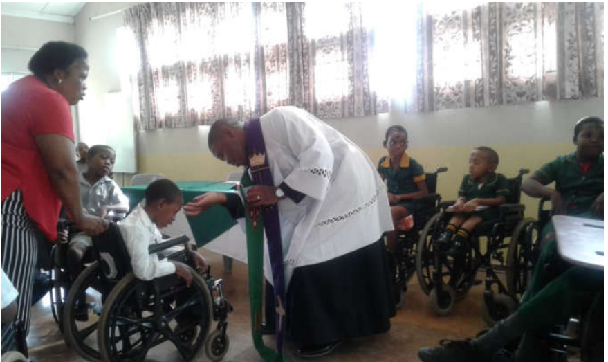
Segnung mit dem Aschenkreuz für behinderte Kinder