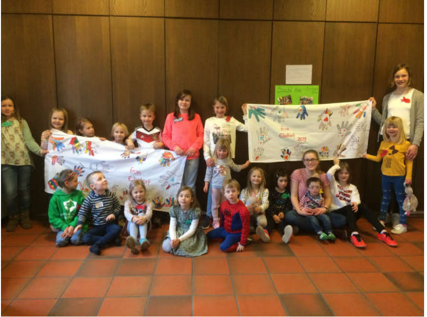
Nach dem Kindergottesdienst in Ebbsfleet