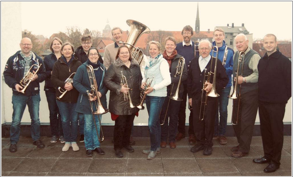
Posaunenchor Ebstorf (S. 6) - Kreative Gemeinde (S. 5)