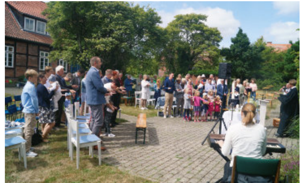
Taufest vor der Barumer Kirche

Bei einer Andacht, Geschichten, Liedern, Gesprächen, Kaffee und Kuchen stimmen wir uns auf die Adventszeit ein.