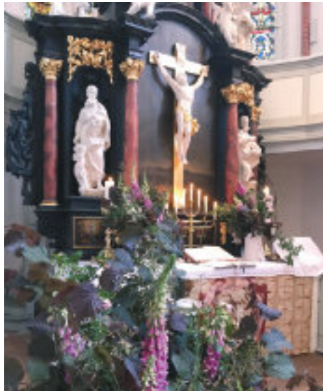
Festlich geschmückter Altar