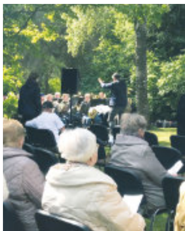
Bläserinnen und Bläser aus der Region im Einsatz