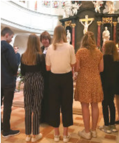
Das erste Abendmahl