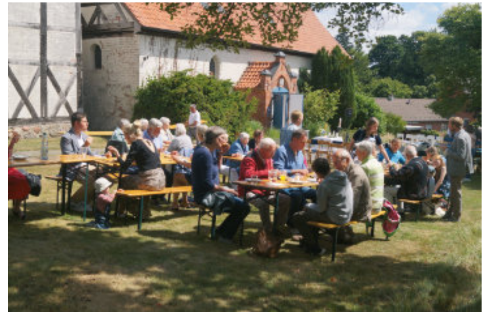
Gemeinsames Mittagessen nach dem Taufgottesdienst