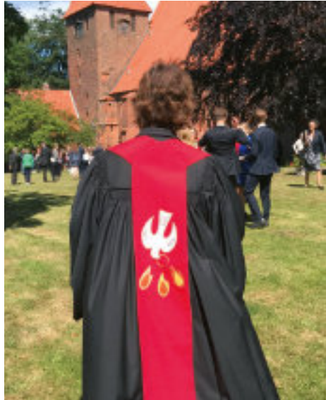
Die rote Stola kommt aus der Partnerkirchengemeinde Ephangweni in Ondini, Südafrika