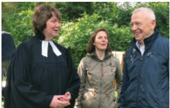
Wir freuen uns auf viele Besucher