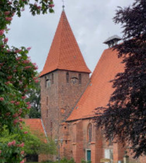
8 Tag des offenen Denkmals