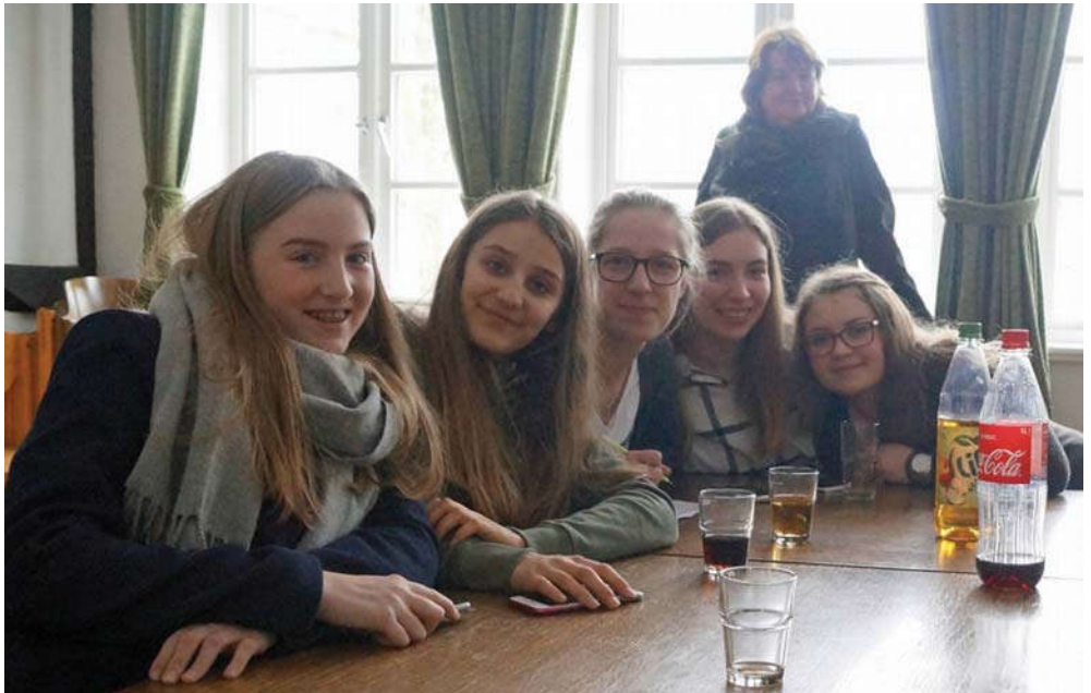
Teamerinnen bei der Vorbereitung