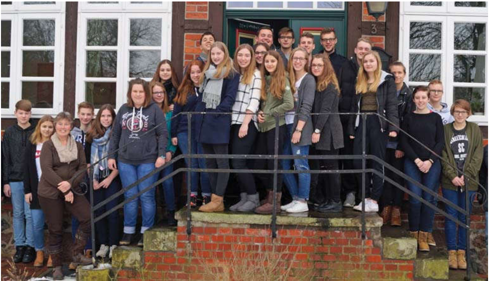
26 Jugendliche aus den Gemeinden Ebstorf, Barum-Natendorf und Hanstedt bereiten gemeinsam die Konfirmandenfreizeit vor. Das Thema wird in diesem Jahr "Taufe" sein.