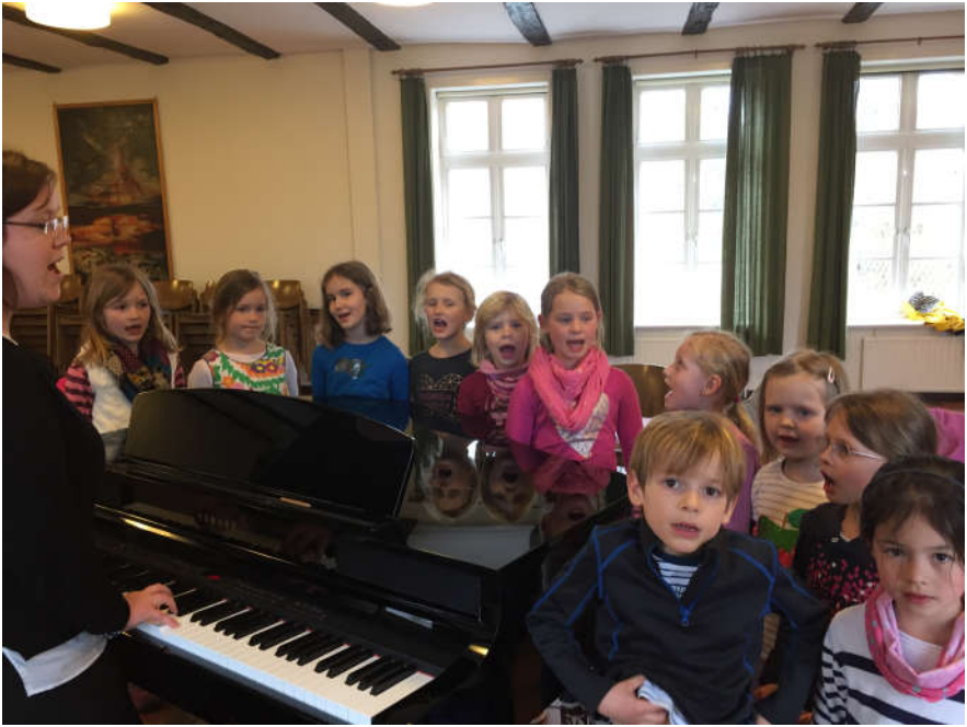
Der Kinderchor beim Üben – schon mit dem neuen Flügel (oben)