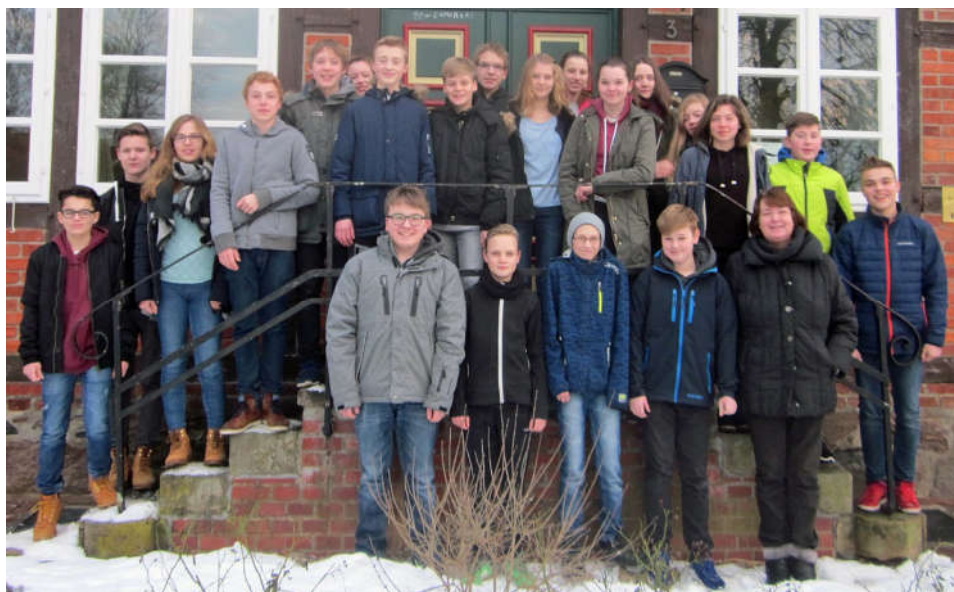
Auf dem Foto fehlt Jakob Schroeter