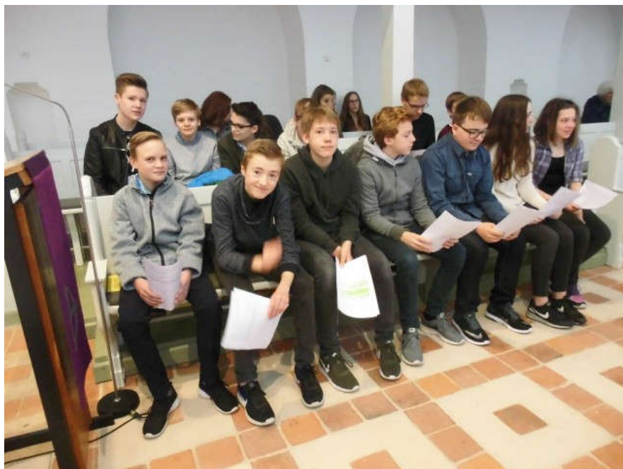
Konfirmandenvorstellung am 26. März in Ebstorf