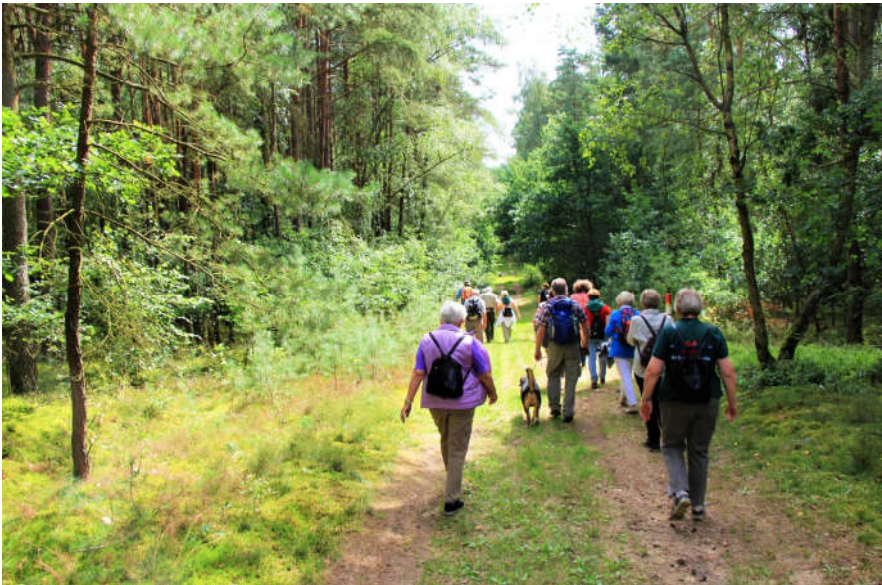
So könnte es auch am Landeswandertag (7. Mai) aussehen (unten)